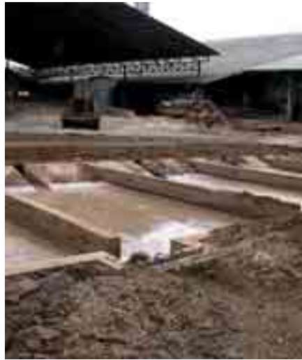
Organische Reststoffe und Abwässer bei der Stärkeherstellung in Thailand

Ziel des zweijährigen Kooperationsprojektes ist zum einen der bilaterale Informationsaustausch zwischen CUTEC und KMUTT über den jeweiligen Stand der Forschung und Technik, um gemeinsam Potenziale zur Verbesserung der Biogastechnik auszuloten. Zum anderen sollen in dem Bereich Gasaufbereitung, in dem der thailändische Stand der Technik noch hinter