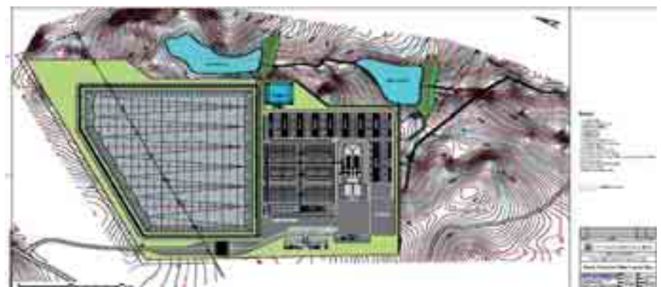
Entwurf einer Deponie und Abfallbehandlungsanlage für Abuja