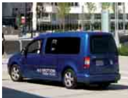
Eines der Brennstoffzellenfahrzeuge der „Hydrogen Road Tour 2009“, das nach 2.700 km in Vancouver ankam

Für das CUTEC-Institut präsentierte Herr Dietrich die Auslegung eines Hochtemperaturbrennstoffzellensystems, welches das Anodenabgas einer SOFC zur Reformierung von Propan verwendet und damit den Wirkungsgrad des Gesamtsystems entscheidend erhöht. Gemeinsame Ergebnisse der im Zentrum für Brennstoffzellen-Technik in Duisburg und in der CUTEC im Rahmen des IGF-Projektes „Entwicklung eines neuartigen Konzeptes propanbetriebener SOFC-Brennstoffzellen durch Reformierung mit partieller Anodenabgas-Rückführung“ (IGF-Projekt Nr. ZN 251) durchgeführten Hardwareentwicklung wurden zur Diskussion gestellt und vom Fachpublikum positiv aufgenommen.