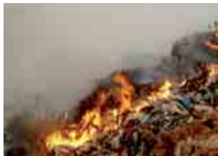
Brennender Müll (Gasbrand)

der Brände im Untergrund werden auf den Flächen noch Lebensmittel angebaut. Auf der großen Deponie weiden Rinder auf den Abfällen und Kinder spielen im Sickerwasser.