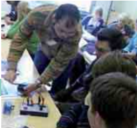
Experimentelle Untersuchungen an Brennstoffzellen wurden mit großem Interesse gemeistert

Eine Woche Verzicht auf wohlverdiente Semesterferien, dafür Vorlesungen, Praktika, Diskussionen und Erarbeitung von Präsentationen: 45 Studenten und Doktoranden aus ganz Niedersachsen nahmen an der 2. Niedersächsischen Brennstoffzellen Summer School in der letzten Woche vor Beginn des neuen Semesters teil und waren vom Gesamtangebot begeistert. „Jederzeit wieder“ war der einhellige Kommentar aller Teilnehmer.