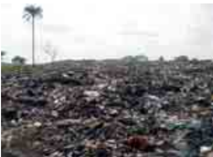
Mülldeponie Gosa, Abuja

Seit 2002 bestehen enge Kontakte zwischen der Regierung in Abuja und der CUTEC. Der Status von CUTEC als Einrichtung des Landes Niedersachsen und die hohe Kompetenz der Mitarbeiter haben die Basis für eine vertrauensvolle Zusammenarbeit geschaffen. Daher wurde im Juli 2006 der Vertrag für eine 5-jährige Tätigkeit als Umweltberater geschlossen. Dieser Vertrag umfasst 9 Themenkomplexe. Dazu gehören ein Umweltaudit, die Prüfung existierender Umweltgesetze, die Entwicklung von Umweltschutzziele, die Prüfung bestehender Abfallbehandlungsanlagen, die Entwicklung und der Entwurf eines Umweltlabors sowie eines Abfallkonzeptes mit Behandlungsanlagen, die Öffentlichkeitsarbeit und das Training der nigerianischen Mitarbeiter in Deutschland.