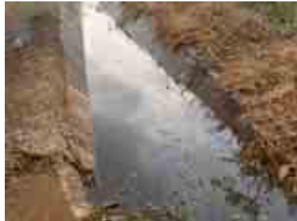
Sickerwasserkanal auf der Deponie Gosa, Abuja

Unsere Tätigkeiten in Abuja haben Probleme im Bereich der Abfallbehandlung aufgedeckt. Brände auf Deponien, die durch die Aktivität thermophiler Bakterien entstehen, extrem toxisches Sickerwasser und eine desaströse Müllabfuhr sind kennzeichnend für die Situation in Abuja. Trotz