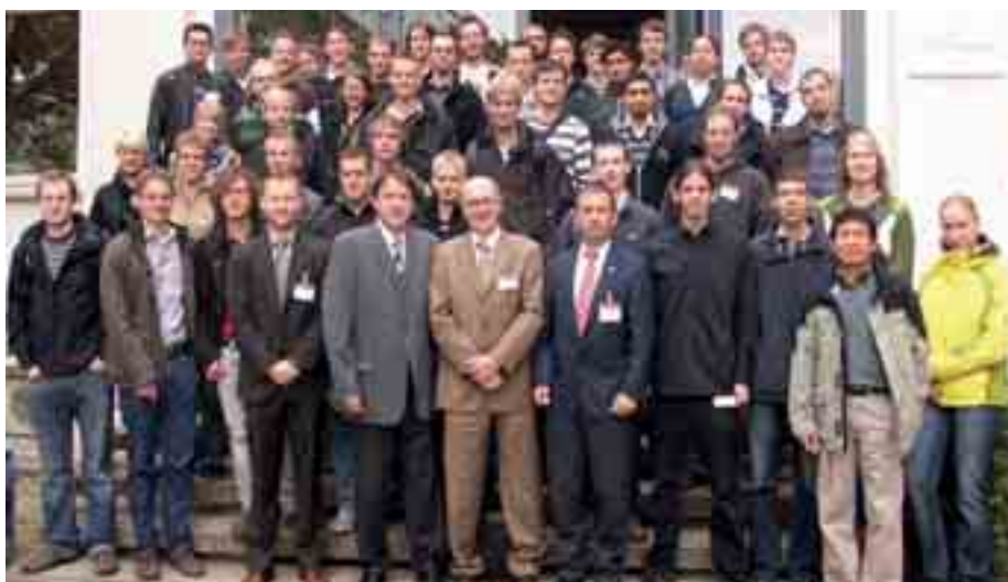
Referenten und Teilnehmer der Summer School