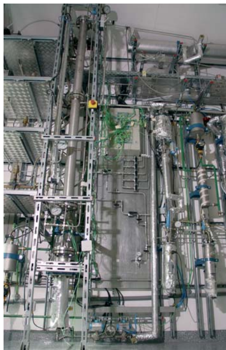
Anlage zur Erzeugung von Fischer-Tropsch-Kraftstoffen