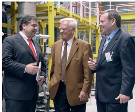
Diskussion über zukünftige Lösungsansätze während der Besichtigung der CUTEC-Anlagen (v. l.: Sigmar Gabriel, Werner Grübmeyer, Prof. Carlowitz)

Am Samstag, dem 17. Mai 2008, besuchte Bundesumweltminister Sigmar Gabriel die CUTEC. In einem kleinen fast „familiären“ Rahmen stellte Prof. Carlowitz in einem Kurzvortrag die CUTEC und ihre strategische Ausrichtung vor. Der Fokus lag hierbei auf der Strategie zur Biomassekonversion. Dieses Thema ist aus politischer Sicht brandaktuell und weckte sofort das Interesse des Umweltministers. In einer lebhaften Diskussion schilderte Herr Minister Gabriel die Probleme, die sich mit Biodiesel aus Pflanzenöl weltweit ergeben. So würden z. B. in Brasilien Sümpfe trockengelegt, nur um weitere Anbauflächen für schnellwachsende Palmen zu schaffen und somit der steigenden Nachfrage gerecht zu werden. Es wurde deutlich, dass eine weitere Erhöhung der Beimischung von Palmöl in den Raffinerieprozess durch politisches Engagement in Zukunft verhindert werden sollte. Es müsse