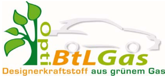
Logo des Projektes

Ausgangslage des Vorhabens war, dass in Güssing und Clausthal zwei Vergaser für die thermische Zersetzung von Biomasse zur Synthesegasherstellung seit einigen Jahren gut laufen. Die Clausthaler Variante zeichnet sich durch