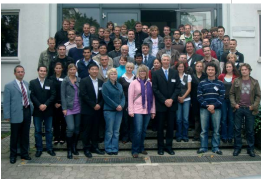
Gruppenbild der Teilnehmer der Summer School

Weitere Bilder unter: www.cutec.de/brennstoffzelle.php